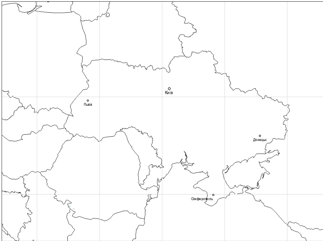
Рис. 1. Розрахункова область чисельної регіональної моделі прогнозу погоди COSMO

Розрахункова область (Рис.1) характеризується наступним чином: кількість вузлів із заходу на схід – 209; кількість вузлів із півдня на північ – 101; кількість рівнів по вертикалі – 50; крок ~ 14 км.