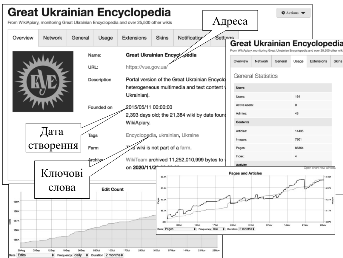
Рис. 1. Сторінка е-ВУЕ на сайті Wikiapi.com

е-ВУЕ використовує семантичні шаблони для подання типових інформаційних об'єктів (ТІО). ТІО – це підмножина сторінок Wiki-ресурсу, що належать до однакового набору категорій, мають однакову або подібну структуру та семантичні властивості. Створення системи ТІО має базуватися на спільній роботі інженера зі знань та експертів Про. В е-ВУЕ ТІО пов'язуються з окремими Wiki-сторінками та базуються на виразних здатностях Wiki-середовища та його семантичного розширення. Зараз в е-ВУЕ виокремлено 32 ТІО, які характеризуються подібним набором семантичних властивостей відповідних Wiki-сторінок: персоналії, міста, країни, організації тощо. Для спрощення та уніфікації створення таких сторінок розроблено відповідні шаблони.