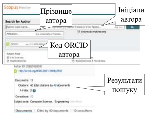
Рис. 1. Наукометричні параметри в Scopus

чення свого індексу Хірша та кількість проіндексованих публікацій (рис. 1).