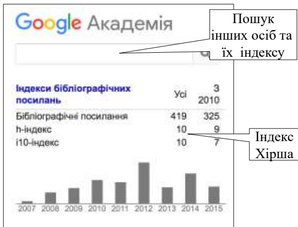
Рис. 2. Наукометричні параметри в Google Scholar

вання коректних посилань у кількох поширених форматах – MLA, APA, ISO 690. Автор публікацій може проглядати список своїх робіт впорядкованим як за роками, так і за кількістю посилань на них, бачити перелік своїх співавторів, якщо вони зареєстровані в Google Scholar. При пошуку можна враховувати час створення і частоту цитування документів. Основні наукометричні показники, що генерує ця НМБД – це індекси Хірша – загальний та окремо за останні п'ять років, та динаміку цитування за роками (рис. 2). Зареєструвавшись, можна довідатися в Google Scholar як власний індекс Хірша, так і індекс Хірша інших осіб.